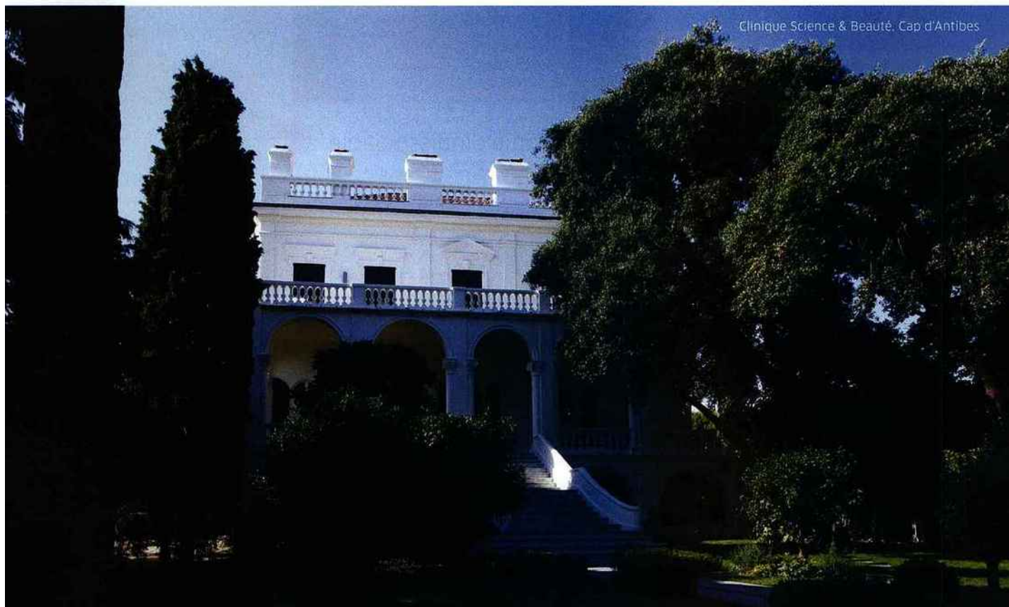
Clinique Science & Beauté, Cap d'Antibes